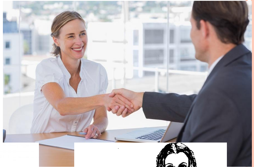
Рис.62. Во время принятия решения.